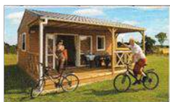
Modèle Cannelle 2 chambres 24 m 2 - 4 ou 5 pers.

Ils sont d'une superficie allant de 24 m 2 à 35 m 2 hors terrasse.