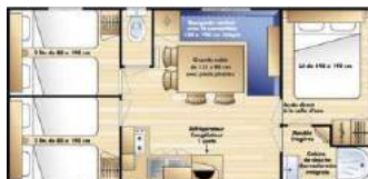
Modèle IRM 32m 2 6 personnes 3chambres