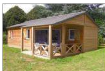
Modèle Fabre 3 chambres 34 m 2 - 6 pers