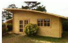
Modèle Arche 3 chambres 35 m 2 - 6/8 pers