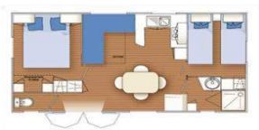
Modèle Florès 32m 2 5 ou 7 pers